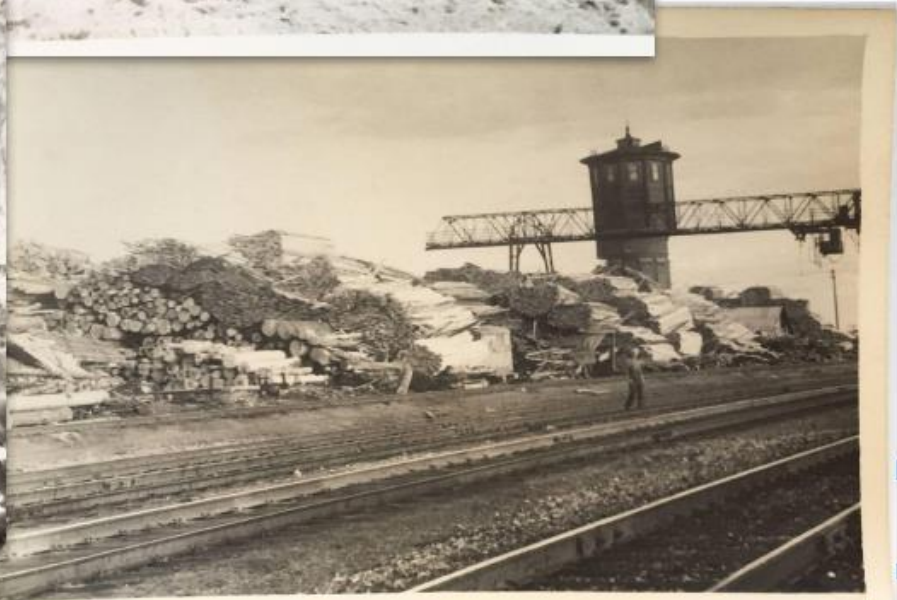
Мадмасский лесопункт. Усть-Вымский р-н. 1972 г.