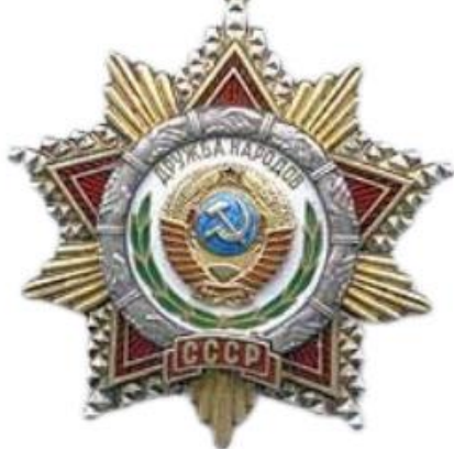
Орден Дружбы Народов 1981 г.