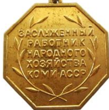
Заслуженный работник народного хозяйства Коми АССР, 1987 г.