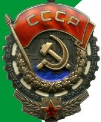
Орден "Трудовое Красное Знамя" 1971 г.