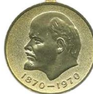
За доблестный труд. В ознаменование 100-летия со дня рождения В.И. Ленина